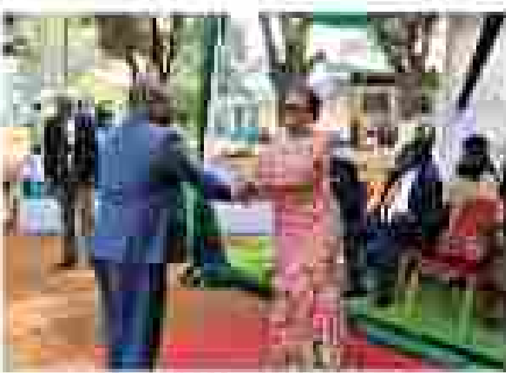
Ministre de Tutelle et le Directeur Général de la CNSS