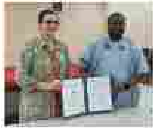
Le 11 février 2024, inauguration.

La Coupe Nationale de Sécurité Sociale et Prévoyance sociale, l'AISSAI a été inaugurée le 11 février 2024, au Professeur d'Abidjan en vue de la construction d'un hôpital de référence dans la perspective d'un meilleur accès aux soins de référence à Abidjan.