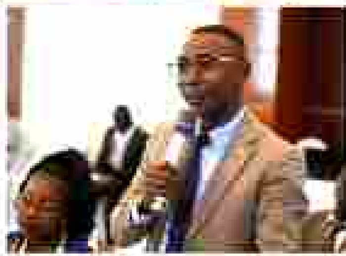
© Association Internationale de la Sécurité Sociale