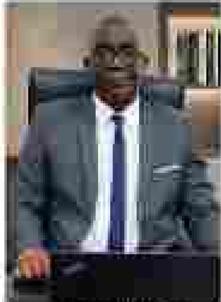
Monsieur le Directeur Général de l'Association Internationale de Sécurité Sociale (AISS) pour la région d'Abidjan et de l'ensemble de nos deux continents.

L' Association de la Sécurité Sociale (A.S.S.) Monsieur le Chef de Division, Soins et Communication et Officier de Liaison de l'AISSAI, premier-vice, son directeur et quelques autres membres de l'Afrique, au moment et les pays membres.