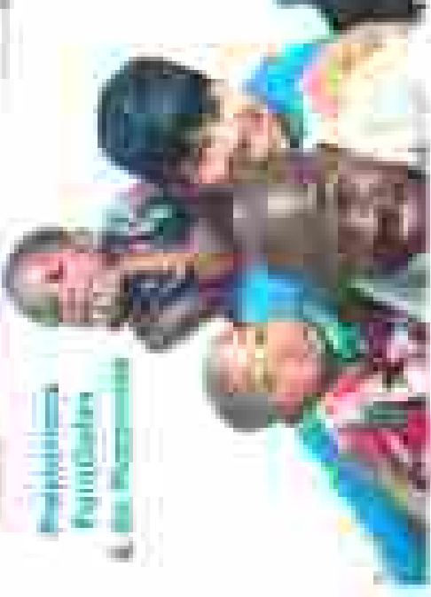
Activités sportives et de loisir