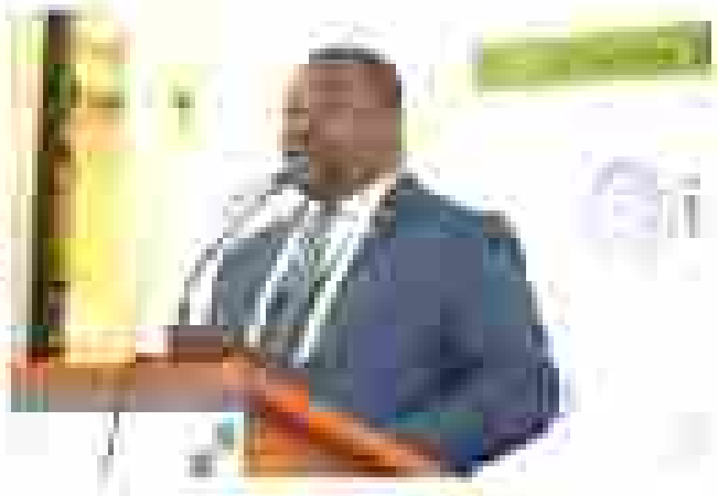
Directeur Général de la CNSS-RCA à l'ouverture du Séminaire Technique