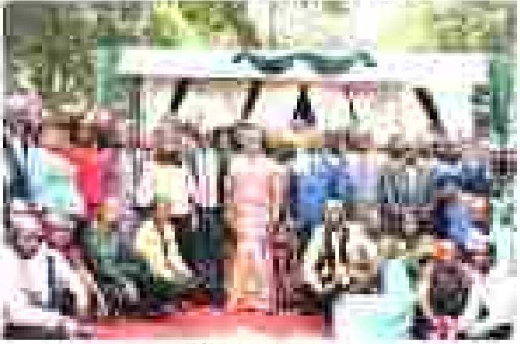
Nouvel An 2026