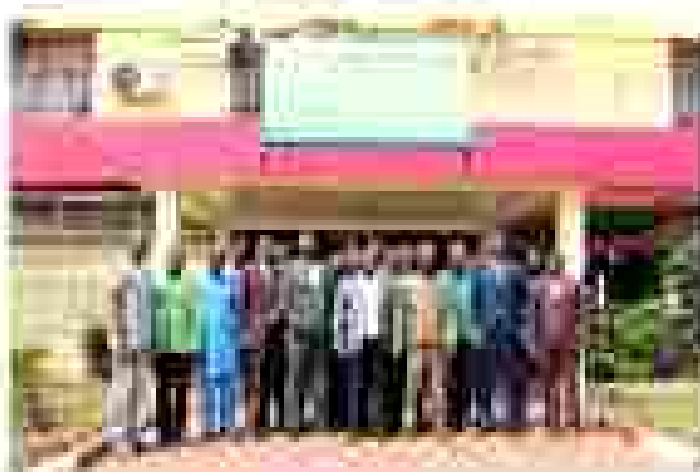
Le 23 janvier 2024, rencontre avec les chauffeurs.

L' e point salient de cette rencontre a été de discuter des difficultés rencontrées par les conducteurs de véhicules de la CNS3 dans l'exercice de leurs fonctions, notamment quelques jours perdus avec certains de leurs véhicules défectueux et autres problèmes rencontrés dans la suite de l'administration de leur travail. Le Directeur Général a été très attentif aux interventions de ces chauffeurs, ainsi qu'aux problèmes rencontrés à cette occasion. En fin de compte, le Directeur Général a promis de veiller à ce que les problèmes rencontrés par les conducteurs de véhicules de la CNS3 soient résolus et que les conditions de travail et d'installation de ces véhicules soient améliorées de façon à ce que les chauffeurs puissent travailler dans de meilleures conditions.